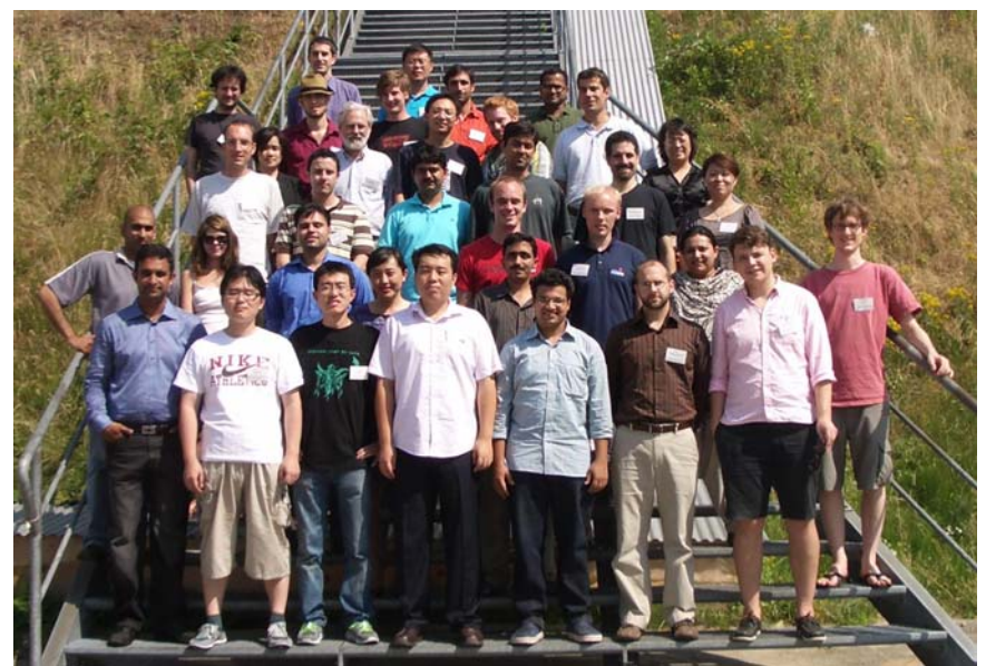
Teilnehmer des 22 nd International Summer Symposiums on Science and World Affairs in Hamburg

In der Zeit vom 9. – 16. Juli 2010 fand am Deutschen Elektronen Synchrotron (DESY) in Hamburg das von der Union of Concerned Scientists (UCS) veranstaltete "Summer Symposium on Science and World Affairs" statt. Das seit 1989 jährlich in Zusammenarbeit mit befreundeten Instituten organisierte internationale Treffen bietet jungen Nachwuchswissenschaftlern die Möglichkeit, sich mit etablierten Experten auf dem Gebiet der Physik, Abrüstungs- und Sicherheitsforschung auszutauschen und aktuelle Themen zu diskutieren. Vorrangiges Ziel des Summer Symposiums ist dabei die Stärkung des Interesses an den naturwissenschaftlich-technischen Aspekten internationaler Sicherheit und die Förderung der Forschung und Ausbildung von Experten in den jeweiligen Heimatländern. Nach Oberwesel am Rhein 1994 und Berlin 2001 fand das Summer Symposium zum dritten Mal in Deutschland statt.