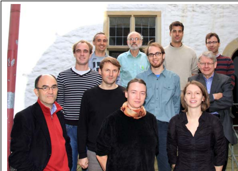
FONAS Jahrestagung 2010 in Osnabrück